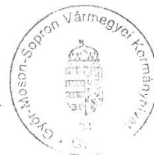
főosztályvezető vármegyei főállatorvos h.